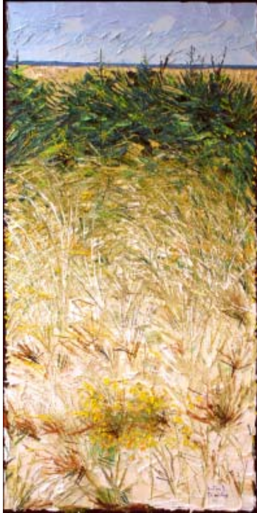
Bertrand Tremblay, huile sur toile

Dunes du Havre aux Basques — îles-de-la-Madeleine