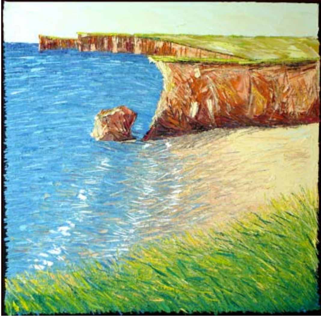
Bertrand Tremblay, huile sur toile