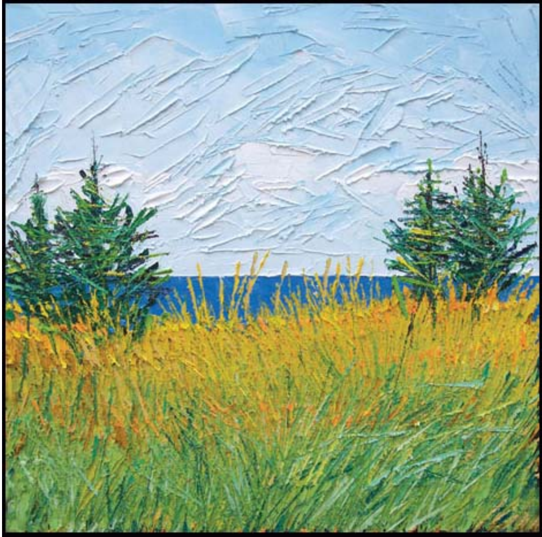
Bertrand Tremblay, huile sur toile