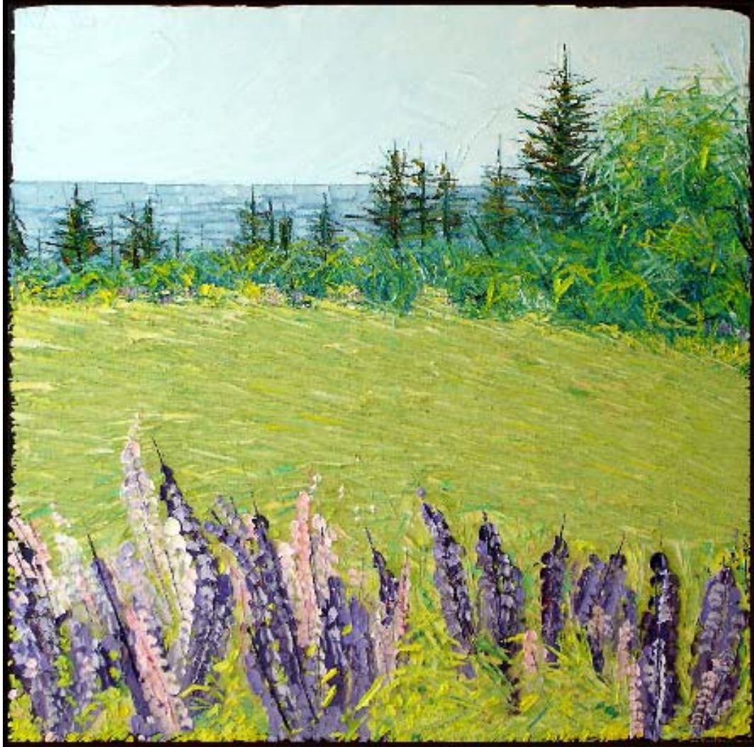
Bertrand Tremblay, huile sur toile