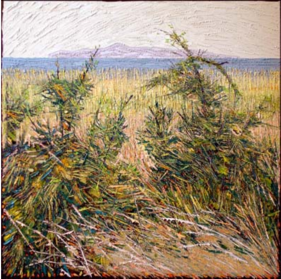
Bertrand Tremblay, huile sur toile

île d'Entrée vue de la plage du Havre aux Basques