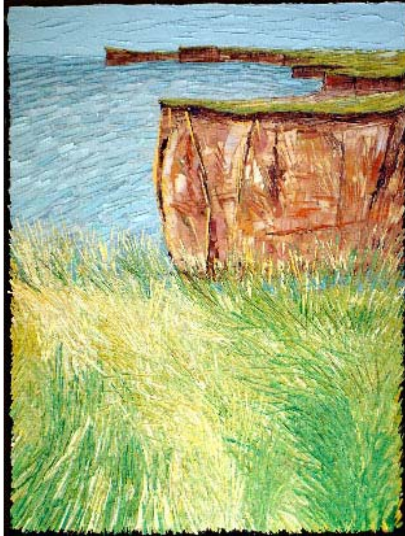
Bertrand Tremblay, huile sur toile

Falaises de Belle-Anse, îles-de-la-Madeleine