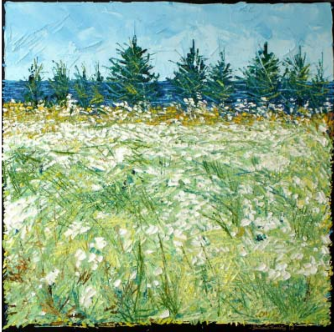
Bertrand Tremblay, huile sur toile